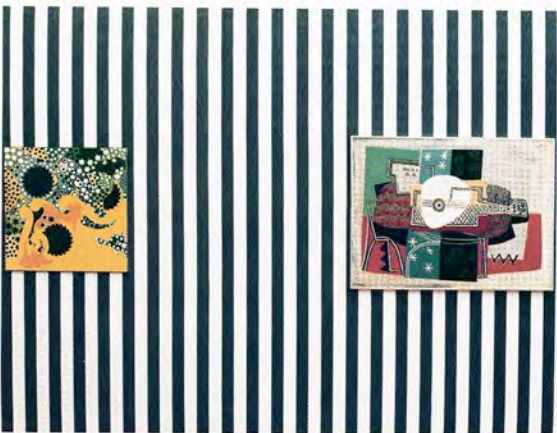
Zaal van Guido Lippens met werk van Lippens en Picasso/Guido Lippens' room showing work by Lippens and Picasso